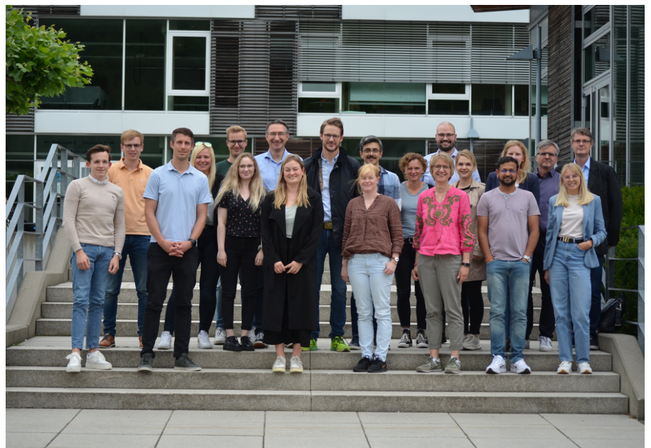
Konsortialtreffen am Standort Meschede der Fachhochschule Südwestfalen

Am 03.07.2023 fand ein EDIH-Konsortialtreffen in Präsenzform an der Fachhochschule Südwestfalen statt. Vertreter aller Projektpartner trafen sich in Meschede, um über aktuelle Entwicklungen und spannende Aktivitäten im Rahmen des Projekts zu diskutieren. Bei anregenden Gesprächen und intensivem Austausch standen neueste Technologien, Öffentlichkeitsarbeit und zukünftige Meilensteine im Fokus. Mit den gewonnenen Erkenntnissen wurde der Grundstein für unsere weitere Zusammenarbeit gelegt.