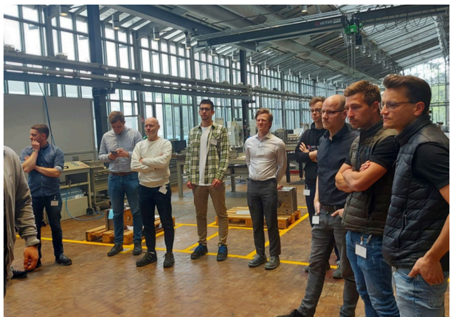
Impressionen aus dem ERFA