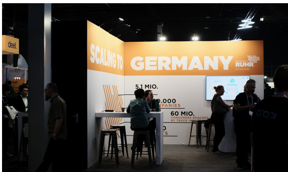
Impressionen vom Innovationtrip zu der The Next Web Konferenz