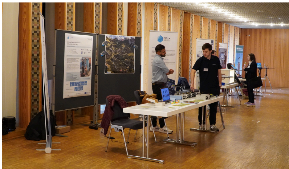
Impression der Aussteller

Die Teilnehmenden erwartete ein vielfältiges Programm aus Vorträgen und Workshops zu Themen wie Cybercrime, Hightech-Innovationen, nachhaltige Digitalisierung und der Nutzung von KI-Tools. Praxisbeispiele aus Unternehmen zeigten, wie digitale Lösungen effizient in der Region eingesetzt werden. Der Digitalum-Bus bot zudem Gelegenheit, moderne Technologien wie 3D-Drucker und CNC-Maschinen hautnah zu erleben.