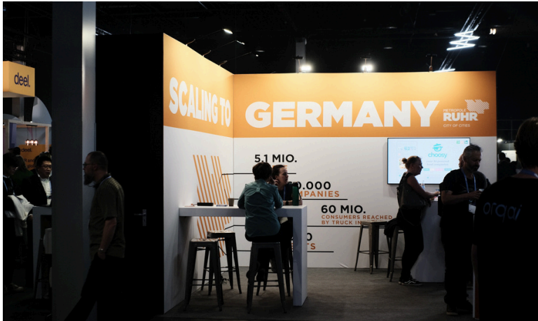
Innovationtrip zu der The Next Web Konferenz

Innovation Trips öffnen die Türen zu den spannendsten Technologie-Hotspots der Welt und bieten die Chance, auf Entdeckungsreise zu gehen, um zukunftsweisende Technologien hautnah zu erleben, neue Trends frühzeitig zu erkennen und wertvolle Partnerschaften zu knüpfen. Diese Reisen ermöglichen nicht nur den Austausch von Erfahrungen, sondern eröffnen auch neue Wege für Zusammenarbeit und Innovation – ein entscheidender Schritt, um die Zukunft aktiv mitzugestalten.