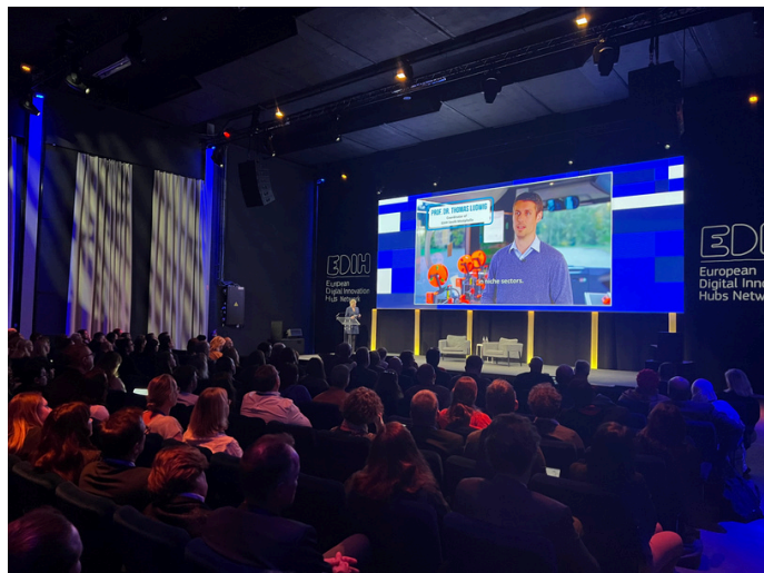
Vorstellungsvideo des Digitalum Bus

Der EDIH Summit 2024 hat bewiesen, wie wichtig die Zusammenarbeit innerhalb Europas ist, um Innovation und Digitalisierung voranzutreiben und wir freuen uns darauf, auch künftig unseren Beitrag zu leisten.